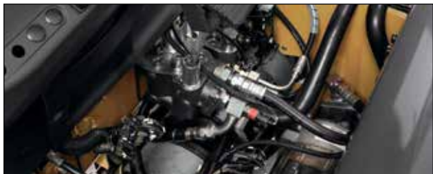
Garantía de fábrica para una mayor protección