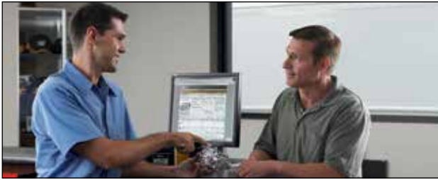
Servicio y soporte local