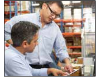
Paquetes de financiamiento a la medida