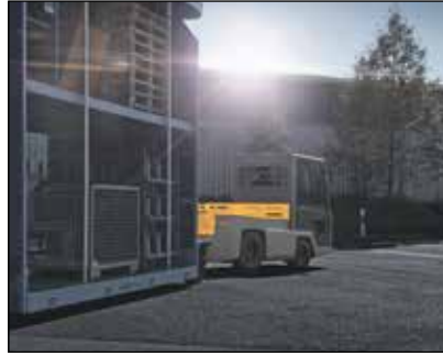
El modo táctil facilita la instalación de remolques

El EZS 7280NA normal viene equipado para alojar 620 Ah. Para aún más capacidad, el EZS 7280XL da cabida a 775 Ah y 930 Ah.