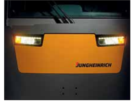
Luces frontales para aumento de visibilidad