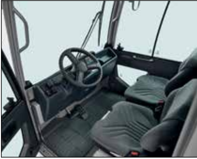
Compartimiento del operador espacioso y confortable