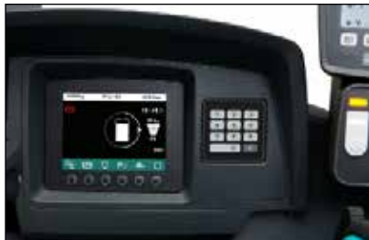
Pantalla a color fácil de leer