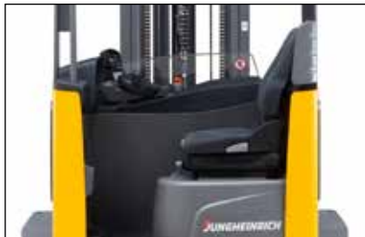
Cinco diferentes modos de dirección